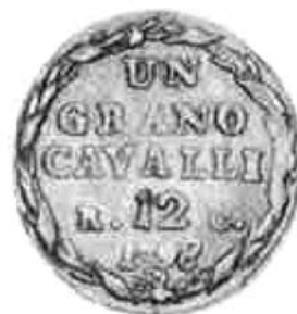
I lotti 675 e 676 dell'asta Varesi 23 dell'ottobre 1996. Ingrandimenti.

del 1797, ma dopo un'attenta analisi risultano appartenere a due differenti tipologie sia per la grandezza dei caratteri della leggenda sia per la grandezza dell'effigie. In entrambi i casi i rovesci sono identici e la presenza della sigla P. al dritto conferma la loro paternità all'incisore Domenico Perger.