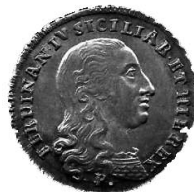
Ferdinando IV di Borbone (I per. 1759-1799). Tari da 20 grana 1798. Argento. Grammi 4,58. Cagiati 14. CNI 269. Pannuti-Riccio 87. Gigante 104.