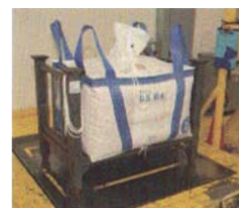
Fig. XIV, imbustamento.

Tornando alla visita, dopo un'accurata perquisizione, manuale ed elettronica, si accede allo shop, dove è possibile acquistare le monete FDC e FS di nuova emissione, ma anche di anni recenti. Al secondo piano c'è un piccolo museo dove sono in mostra alcuni cimeli storici: bilance, torchi, bauli usati per il trasporto delle monete. Infine, al terzo piano, inizia il percorso (fig. IX) all'interno di un tunnel di vetro, lungo decine di metri, da dove si spazia su di un enorme hangar e, avanzando, si possono osservare tutte le fasi della coniazione, attraverso numerosi e sofisticati macchinari: dal taglio dei tondelli alla coniazione vera e propria, fino al riempimento di enormi sacchi con le monete pronte per essere spedite nei luoghi di distribuzione della Federal Reserve (figg. X-XIV). Sarebbe auspicabile che anche la nostra zecca prevedesse un percorso simile, risulterebbe molto istruttivo, soprattutto per le nuove generazioni, magari collegandolo con una sezione distaccata del museo della zecca.