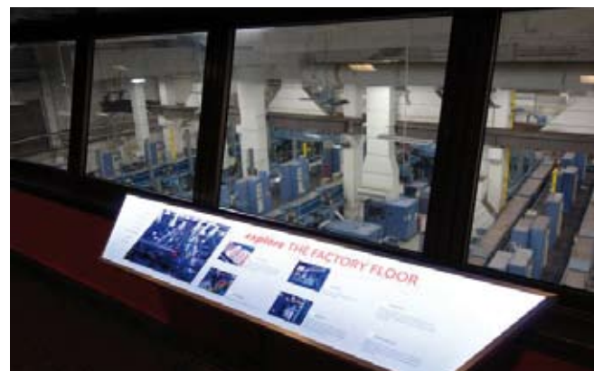
Fig. IX (sopra e sotto).