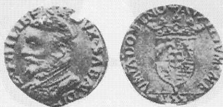
Testone di Aosta - I tipo - CNI 46 - Sim. 33/1 (la foto è di quello di Vercelli, Aosta porta la lettera A)

lettere intorno AUXILIUM MEUM A DOMINO et u millesimo corrente; inoltre scuti, che haveranno da un canto le arme de Savoia coronate al solito cum lettere intorno E. PHILIBERTUS DUX SABAUDIE COMES AST: et dell'altro la croce di Santo Maurizio cum lettere all'intorno AUXILIUM MEUM A DOMINO et il millesimo corrente; testoni, che haveranno d'un canto il protrato et effigie di S.A. et dell'altro le arme de Savoia coronate cum doi leoni rampanti et le lettere dintorno d'un canto et l'altro come sopra detto; pezzi da grossi tre detti cavallotti, et saranno della medesima stampa dei precedenti saluo muttar il nome in quel di Sua Altessa; grossi, pure come i precedenti ma col nome del nuovo Duca; quarti, et saranno d'un canto cum FERT, et dell'altro la croce di Santo Maurizio cum il nome di Soa Altessa... inoltre si noti che il COMES AST dovette aggiungersi anche nella leggenda delle monete piccole" (7).