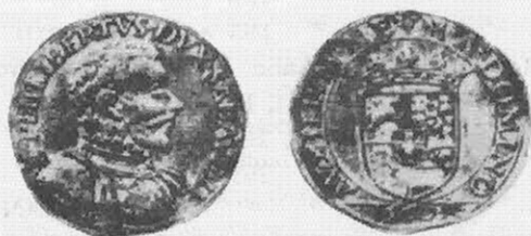
Testone IV tipo - CNI 63 - Sim. 36/2