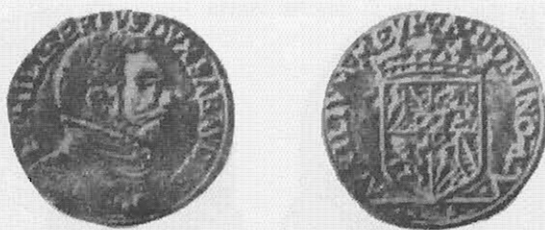
Testone di Asti - III tipo - CNI 47 - Sim. 4/1

Dèi testoni del periodo ducale di Emanuele Filiberto, battuti ad Asti, l'unico conosciuto sicuramente attribuibile a quella zecca è descritto nel CNI al n° 47 con la data 1559, riportato dal Simonetti al n° 4/1 (11), con la leggenda: E PHILIBERTUS DUX SABAUDIE CO AST ed al rovescio; AUXILIUM MEUM A DOMINO.