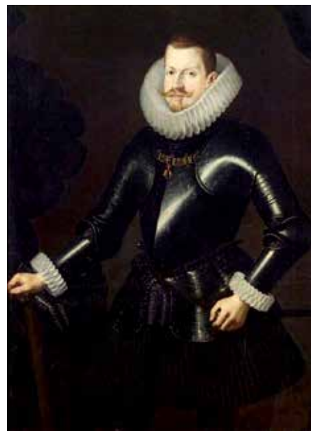
Andres Lopez Polanco, Ritratto di Filippo III d'Asburgo re di Spagna .