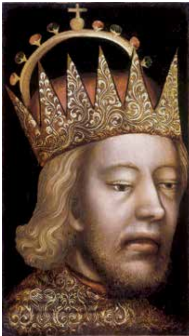
Rodolfo IV con la corona di duca d'Austria.

Per trovare le motivazioni di questo gesto bisogna semplificare il percorso tortuoso della storia ampliando il punto di vista ed esaminare non solo il regno di Napoli, che era un'importante provincia del Regno di Spagna, ma anche l'Europa e gli avvenimenti che durante il XVI secolo la sconvolsero.