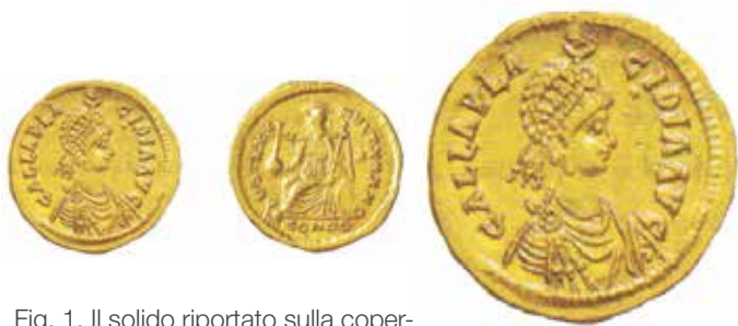
Fig. 1. Il solido riportato sulla copertina del catalogo d'asta citato merita alcune considerazioni: del peso di 4,5 grammi è stato coniato a Ravenna attorno al 421-422. Al diritto, il busto diadematato della imperatrice (era moglie di Costanzo III) con legenda GALLA PLACIDIA AVG. Al rovescio, Costantinopoli o Roma seduta con globo crucigero e scettro; la legenda è VOT XXX MVLT XXXX S (questo rovescio è lo stesso di Valentiniano III e Teodosio II, idem per la legenda; impronta e legenda non sono però gli stessi riportati dal catalogo nella descrizione della moneta per Placidia). In esergo CONOB. A lato della figura una stella. Cohen 2 var.

Nella importante opera di Giovanni Tredici ( Monete imperiali romane , ed. Varesi, stampato nel 2013) si indica il n. 2 per Galla Placidia ma con legenda diversa: si veda il n. 39 per Valentiniano III e il 22 per Teodosio II. La moneta qui illustrata è stata proposta, come detto, nella vendita Inasta 63. Mi sembra quindi che la descrizione e l'attribuzione di questa pur bellissima moneta nel catalogo citato non siano corrette.