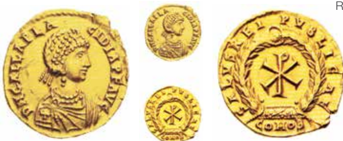
Fig. 7. Semisse di circa 2 grammi coniato a Ravenna o Roma nel 421-422. Al diritto, D N GALLA PLACIDIA P F AVG con busto giovanile della imperatrice. Al rovescio, SALVS REIPVBLICAE e Chi-Rho in corona; COMOB in esergo. Cohen 10, RIC 2054 per Valentiniano III, Giovanni Tredici 7 (ex asta NAC 67/2012, Archer M. Huntington Collection, n. 240).