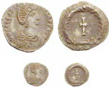
Fig. 9. Mezza siliqua di 1,20 grammi coniata a Ravenna nel 425. Al diritto, DN GALLA PLACIDIA P F AVG con busto della imperatrice. Al rovescio, anepigrafe, croce in corona; R V in esergo. Cohen 18, RIC 1811, Giovanni Tredici 14 (ex asta NAC 40/2007, n. 889).

A Ravenna esiste un magnifico edificio, patrimonio dell'umanità protetto dall'Unesco, noto come Mausoleo di Galla Placidia in quanto, secondo la tradizione, fu fatto costruire da essa; al suo interno vi sono tre sarcofagi che la tradizione assegna