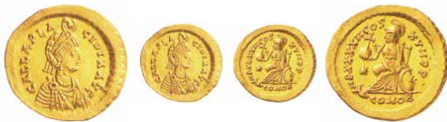
Fig. 2. Solido di 4,43 grammi coniato per Galla Placidia in età più matura a Costantinopoli. Al diritto, GALLA PLACIDIA AVG con il classico busto della imperatrice. Al rovescio, Costantinopoli seduta in trono con globo crucigero e stella nel campo, la legenda è IMP XXXII COS XVII P P; COMOB in esergo. Cohen 2, RIC 317 per Teodosio II, Giovanni Tredici 2 (ex asta NAC 24/2002, n. 335).

Nella importante opera di Giovanni Tredici ( Monete imperiali romane , ed. Varesi, stampato nel 2013) si indica il n. 2 per Galla Placidia ma con legenda diversa: si veda il n. 39 per Valentiniano III e il 22 per Teodosio II. La moneta qui illustrata è stata proposta, come detto, nella vendita Inasta 63. Mi sembra quindi che la descrizione e l'attribuzione di questa pur bellissima moneta nel catalogo citato non siano corrette.