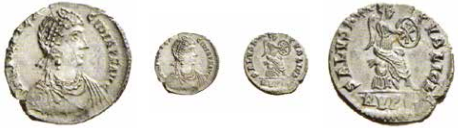
Fig. 8. Siliqua di poco più di 1,5 grammi d'argento coniata a Ravenna tra il 425 e il 450. Al diritto, DN GALLA PLACIDIA PF AVG, testa diadematata di Galla Placidia con busto drappeggiato rivolto a destra. Al rovescio, SALVS REIPUBLICAE; in esergo RVPS, Vittoria seduta rivolta a destra, con scudo sul quale incide un Chi-Rho. Cohen 5, RIC 2082, Giovanni Tredici 4 (ex asta NAC 64/2012, n. 1359).

sua influenza la rese un personaggio importante alla corte occidentale.