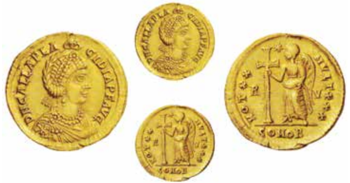
Fig. 4. Solido di 4,46 grammi coniato a Ravenna tra il 426 e il 430. Al diritto, DN GALLA PLACIDIA P F AVG con busto di Galla Placidia rivolto a destra, il capo è diadematato con collana; cristogramma sulla spalla destra del busto. Al rovescio, VOT XX MVLT XXX, R V nel campo; la Vittoria in piedi rivolta a sinistra, COMOB in esergo. Cohen 13, RIC 2012, Giovanni Tredici 10 (ex asta NAC 59/2011, n. 1200; v. anche asta Nomisma 34/2007).

Galla rimase ad Aquileia per diversi mesi, mentre si procedeva all'eliminazione dei sostenitori di Giovanni; da qui promulgò diverse leggi, tra cui alcune volte ad annullare la legislazione di Giovanni che estendeva ai pagani alcuni diritti riservati ai cristiani. Da Aquileia l'Augusta – non dimentichiamo che aveva sposato un imperatore – si spostò a Ravenna e da qui si mosse a sud in autunno per fare un ingresso trionfale a Roma con i figli Onoria e Valentiniano. Il 23 ottobre il giovanissimo Valentiniano, che all'epoca aveva 6 anni, salì al trono, divenendo Augusto d'Occidente, ma il potere effettivo andò a Galla Placidia in qualità di tutrice del figlio. La sua politica negli anni a seguire fu quella di sostegno alla Chiesa di Roma ma, soprattutto, alla visione di un impero unito. La tutela di Galla durò legalmente dodici anni (425-437), ma anche in seguito la