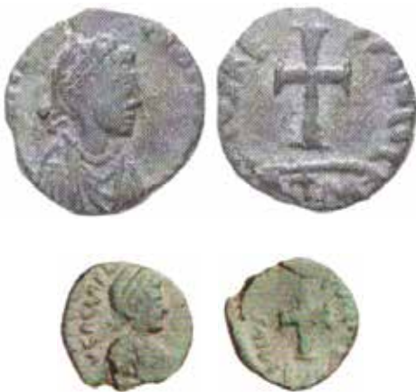
Figg. 10 e 10 bis. AE 4, molto ingrandito, di poco più di 1 grammo, coniato probabilmente a Roma tra il 425 e il 430. Al diritto, busto di Galla e DN GALLA PLACIDIA P F (o P P) AVG. Al rovescio, grande croce e legenda SALVS REIPUBLICAE; R croce M o RPM in esergo. Cohen 11, RIC 2113, Giovanni Tredici 8 (Internet: Antiqua: le monete di Galla Placidia , asta Helios 4/2009, n. 730).