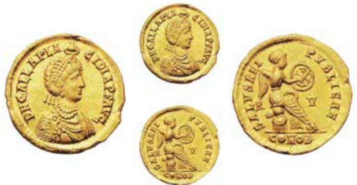
Fig. 6. Solido di tipologia diversa dai precedenti del peso di 4,51 grammi coniato a Ravenna nel 422. Al diritto, D N GALLA PLACIDIA P F AVG con classico busto della imperatrice. Al rovescio, SALVS REIPVBLICAE e Vittoria seduta su una corazza verso destra che incide un Chi-Rho su uno scudo; R V al lati, COMOB in esergo. Cohen da 3 a 7, RIC 1333 per Onorio, Giovanni Tredici 3 (ex asta ACR Art Coins Roma 6/2012, n. 1274).