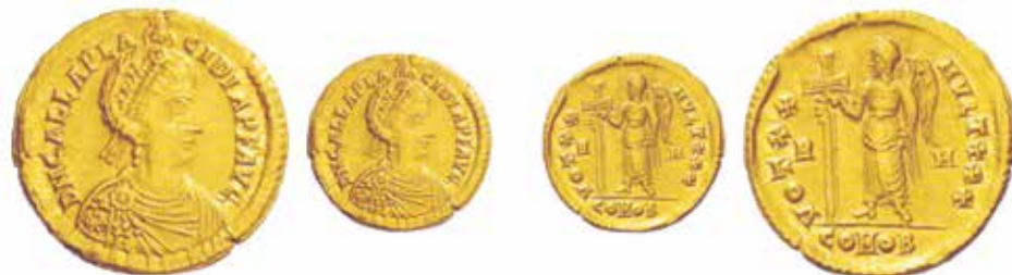
Fig. 3. Solido di circa 4,50 grammi coniato a Roma nel 425-426. Al diritto, il busto di Galla e DN GALLA PLACIDIA P F AVG, con cristogramma sulla spalla destra. Al rovescio, una Vittoria tiene una lunga croce; la legenda è VOT XX MVLT XXX; R M nel campo; COMOB in esergo. Cohen 13, RIC 2007, Giovanni Tredici 10 (ex asta NAC 46/2008, n. 746).