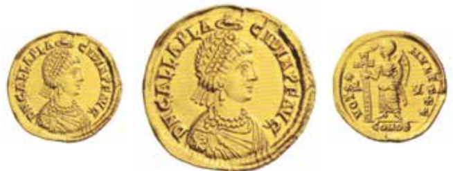
Fig. 5. Un solido simile al precedente nell'impronta ma leggermente diverso nella incisione, come del resto capitava spesso in quegli anni.