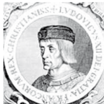
Luigi XII (1498-1515). Regnò ad Asti prima come duca poi come re di Francia.