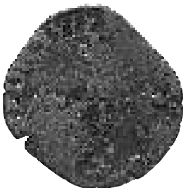
Ingrandimento prima moneta.

D/ + HER. ET. CONCOM. RAD . (et). PASSA. 1585. grande H coronata fra tre gigli.