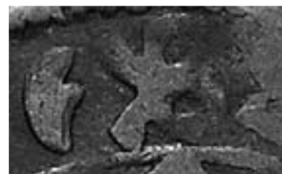
Ingrandimento dei due simboli di zecca: la piuma e la &.