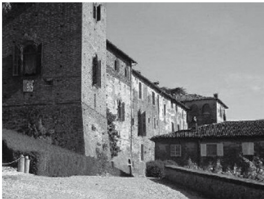
Il castello dei Radicati a Passerano .