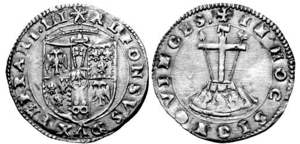
Figura 20 Scudo d'oro del sole di Alfonso I d'Este (1505-1534), Ferrara. Al dritto stemma estense coronato; al rovescio la Croce sul Calvario, sul braccio destro è appoggiata la lancia, sul sinistro l'asta con la spugna.