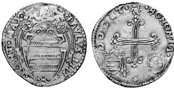
Figura 15 Scudo d'oro (3,11 g) di Paolo IV (1555-1559), Bologna. (ex asta UBS Gold & Numismatics 84, 19 gennaio 2010, lotto 1120)