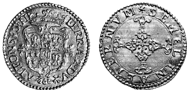
Figura 10 Scudo d'oro del sole (3,20 g) di Alfonso II d'Este (1559-1597), Ferrara. (ex asta Varesi 53, 29-30 aprile 2009, lotto 1113)