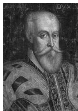
Figura 1. Alfonso II d'Este, olio su tavola, secolo XVI, collezione BSGSP. (da Ducato di Modena e Reggio 1598-1859, Banco San Geminiano e San Prospero, Modena, 2007).