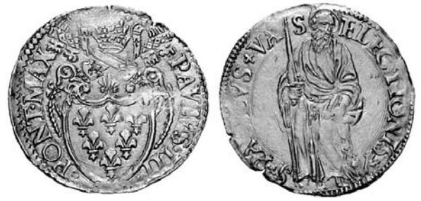
Figura 18 Scudo d'oro (3,35 g) di Paolo III (1534-1549), Roma. Al rovescio san Paolo di fronte che regge, con la mano sinistra, il vangelo e, con la destra, una spada eretta. (ex asta Chaponnière & Hess-Divo 1, 18 maggio 2010, lotto 701)