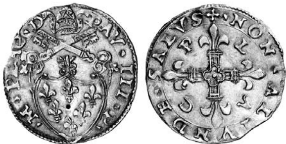
Figura 17 Scudo d'oro di Paolo III (1534-1549), Piacenza. (ex asta Heidelberger Münzhandlung Herbert Grün 53, 20 maggio 2010, lotto 739)