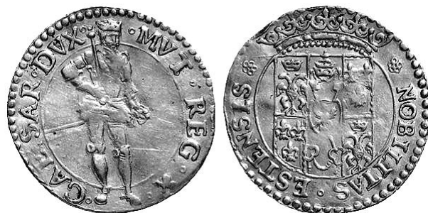
Figura 11 Ongaro in oro di Cesare d'Este (1597-1628), Modena. Al dritto il duca coronato stante con scettro, al rovescio stemma coronato. (ex asta InAsta 28, 23 novembre 2008, lotto 1412)

Esistono anche grida sull'usura, i contratti illeciti, sugli amministratori, sulla caccia, sui luoghi riservati, sulla licenze, sull'espatrio, sui prigionieri, i testimoni, i massari, sull'applicazione delle pene, ed altro ancora. Ad esempio "Dichiarando però che sia lecito dietro le strade publiche delli soddetti Luoghi sparare et ammazzare Nibij, Favazzi 11 , Cornachioni 12 , Poiane, Lupi, Volpi, et Uccelli che non si sogliono riputare buone selvaticine." , "E più che al tempo delle nevi non sia lecito ad alcuna Persona andare a Caccia di Lepri, e di altri simili salvaticini come Cingiali e Caprioli, nei lioghi soddetti permessi come sopra, sotto la pena di scudi 25 d'oro et tratti due di Corda." , "E più che niuno