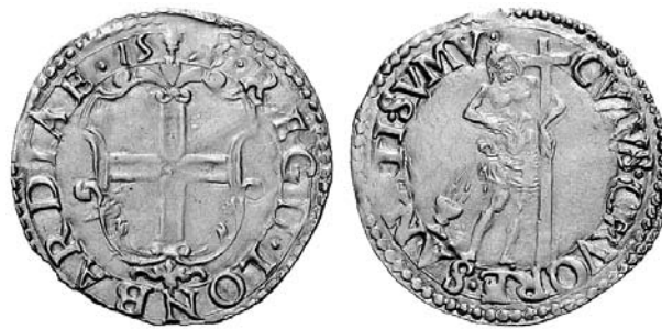
Figura 13 Scudo d'oro (3,36 g) Ercole II d'Este (1534-1559), Reggio Emilia. Al dritto stemma di Reggio. Sul rovescio la figura frontale di Cristo, con il braccio sinistro stringe la croce mentre appoggia il destro al costato, dalla ferita esce sangue che si riversa in un calice. (ex asta Chaponnière & Hess-Divo 1, 18 maggio 2010, lotto 647)