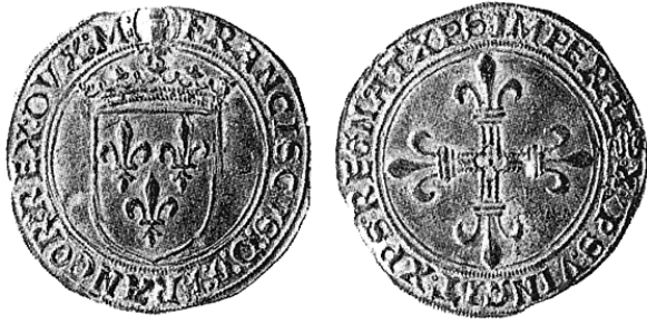
Figura 14 Scudo d'oro del sole (3,40 g) di Francesco I d'Angoulême (1515-1522) re di Francia e duca di Milano, zecca di Milano. Al dritto scudo di Francia coronato. (da La zecca e le monete di Milano. Edizioni Mazzotta, Milano, 1983)