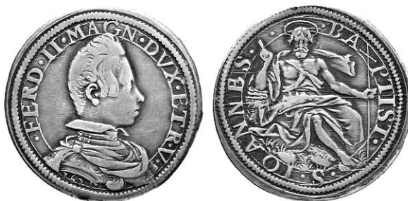
Figura 25 Testone 1621 di Ferdinando II (1621-1670), Firenze. (ex asta InAsta 20, 19 maggio 2007, lotto 1286)