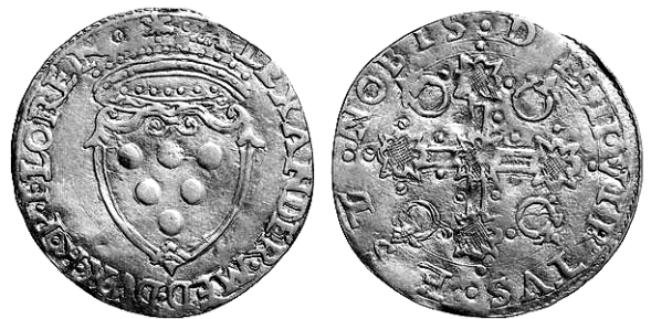
Figura 19 Scudo d'oro di Alessandro de' Medici (1532-1537), Firenze. (ex asta InAsta 35, 1 luglio 2010, lotto 3204)