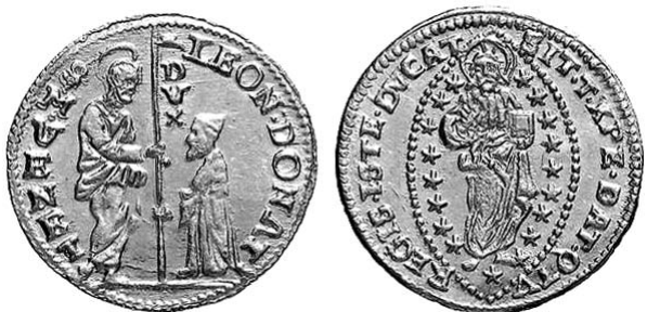
Figura 22 Zecchino in oro di Leonardo Donà (1606-1612), Venezia. (ex asta InAsta 28, 23 novembre 2008, lotto 1071)