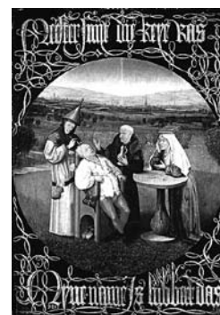
Figura 21 Estrazione della pietra della follia, olio su tavola (datato intorno al 1478) di Hieronymus Bosch (1450-1516), Museo del Prado, Madrid. L'opera si collega a un detto popolare secondo cui i pazzi hanno un sasso nella testa. Bosch, ad ogni modo, non risparmia una critica al chirurgo che è raffigurato con un copricapo a imbuto, simbolo di stupidità; il dotto crede di sapere ma, forse, è più ignorante del folle che deve curare.

Quelli riportati non sono che pochi esempi. La lettura di notificazioni, editti, grida, ci riporta indietro nel tempo, ci fa rivivere momenti del passato e, nello stesso tempo, ci ricorda le nostre origini, la nostra storia, ci racconta di monete e consuetudini ormai dimenticate. Chissà quante notizie, curiosità, anche di carattere numismatico, sono ancora sepolte fra le carte conservate in polverose cantine, negli archivi storici disseminati in tutta Italia. Notizie che stanno tranquillamente aspettando che qualcuno, armato di pazienza infinita, le possa finalmente riscoprire e divulgare.