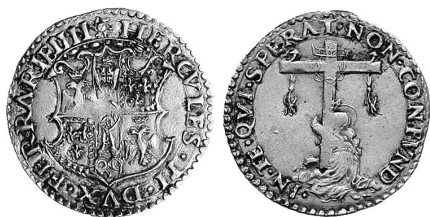
Figura 9 Scudo d'oro del sole (3,35 g) di Ercole II d'Este (1534-1559), Ferrara. Al dritto stemma estense coronato, al rovescio la Maddalena genuflessa a sinistra ed abbracciata alla croce alla quale sono appesi due flagelli e la corona di spine. (ex asta Varesi 56, 3 giugno 2010, lotto 143)

dotati, con l'esperienza e la pratica acquisivano una manualità tale da diventare chirurghi egregi e famosi. La famosa massima Ecclesia abhorret a sanguine (la Chiesa aborre dal sangue) segna il divieto di praticare la chirurgia e la dissezione