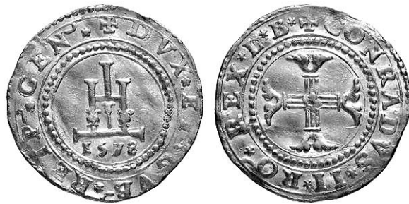
Figura 23 Doppia in oro 1578 dei dogi biennali (seconda fase 1541-1637), Genova. (ex asta InAsta 28, 23 novembre 2008, lotto 1270)