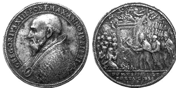
Figura 6 Medaglia 1575 in bronzo di Gregorio XIII (1572-1585). Al dritto il busto del pontefice rivolto a sinistra; al rovescio la scena dell'apertura della Porta Santa. (ex asta InAsta 30, 23 maggio 2009, lotto 4524)