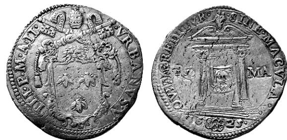
Figura 24 Testone 1525 di Urbano VIII (1623-1644), Roma. Al rovescio l’immagine della Porta Santa. (ex asta InAsta 23, 10 novembre 2007, lotto 1369)