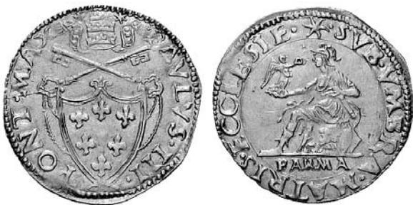
Figura 16 Scudo d'oro (3,35 g) di Paolo III (1534-1549), Parma. Al rovescio Pallade seduta, volta a sinistra, regge con la mano destra una Vittoria. (ex asta Chaponnière & Hess-Divo 1, 18 maggio 2010, lotto 700)