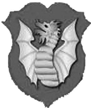
Figura 8 Stemma della famiglia Boncompagni: di rosso al mezzo drago spiegato d'oro. La coda tronca del drago Boncompagni dimostrava, secondo una interpretazione dell'immagine araldica, che il rettile alato era innocuo perché aveva perso l'aculeo avvelenato con il quale, secondo le credenze del tempo, queste creature sataniche inoculavano il veleno nelle loro vittime.

contro 24) pertanto gli speculatori trattenevano il ducato e facevano circolare lo scudo d'oro. Ancora una volta la famosa legge di Gresham, per cui la moneta cattiva, in questo caso lo scudo, scacciava la moneta buona, il ducato, veniva confermata. Così lo scudo d'oro, con i suoi multipli e sottomultipli, divenne il pezzo dominante nella circolazione aurea.