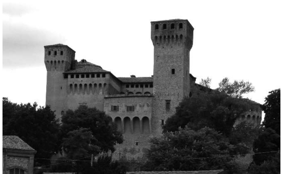
Figura 4 La rocca medievale di Vignola.

Seguono bandi e grida generali che, oltre a definire le pene corporali e pecuniarie per i reati, forniscono un quadro della vita quotidiana a Vignola nel XVII secolo. Ad esempio per “ bestemmia e vilipendio de santi ” le pene erano decisamente severe. “ Prima siccome sopra tutte le altre cose si deve amare et honorare Iddio, così parimenti Sua Eccellenza Ordina, e Comanda che non sia persona alcuna, e di qualsivoglia stato, grado, e condizione si sia, et di qual privileggio si voglia privilegiata, che ardisca, o presumi in modo alcuno Bestemmiare, maledire, o in qualche altro modo disonestamente nominare il SS. Nome di Dio, di Giesù Christo, della Gloriosa Vergine Maria Madre sua, o d'alcun Santo, o Santa sotto pena la prima volta di scudi dieci [...], e per la seconda volta, che incorerà in detto errore, oltre la suddetta pena li sij forata la Lingua et posto in Berlina publica, e per la terza volta, in diversi tempi però,