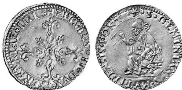
Figura 12 Scudo d'oro del sole (3,36 g) di Ercole II d'Este (1534-1559), Modena. Al dritto croce gigliata, al rovescio san Geminiano. (ex asta Nomisma 41, 8-9 maggio 2010, lotto 790)