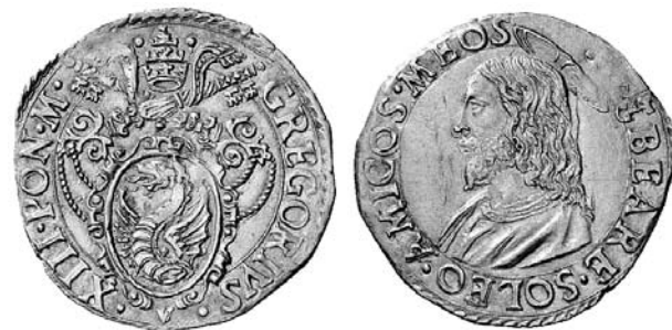
Figura 7 Scudo d'oro (3,30 g) di Gregorio XIII (1572-1585), Roma. Al dritto stemma ovale in cornice sormontato da triregno e chiavi decussate; al rovescio busto del Redentore volto a sinistra, attorno la scritta BEARE SOLEO AMICOS MEOS (sono solito far felici i miei amici). (ex asta Hess-Divo AG 315, 29 ottobre 2009, lotto 1266)