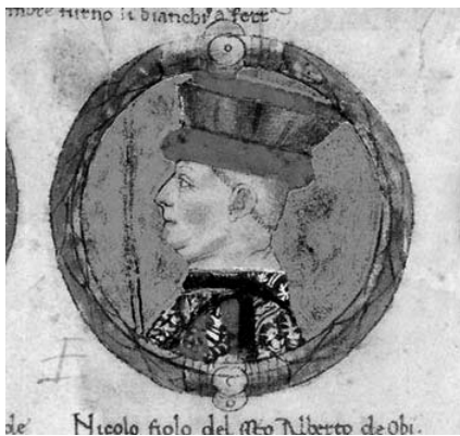
Figura 3 Niccolò III d'Este (Ferrara 1383-1441). Grazie ad un'attenta politica di alleanze e mediazione riuscì ad ingrandire i domini estensi. Oltre che per le vicende politiche Niccolò è ricordato anche per le sue peripezie amorose, si racconta che durante la sua vita abbia avuto più di 800 amanti. Tanto che a Ferrara circolavano molti aneddoti al riguardo, ad esempio, si diceva che “di qua e di là dal Po son tutti figli di Niccolò”, era definito “il gallo di Ferrara”, si affermava che “in Ferrara e nel contado non c'era cantone ove egli non avesse alcun figlio bastardo”. Le mogli ufficiali furono comunque “solo” tre. (da www.castelloestense.it )