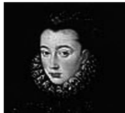
Figura 5 Lucrezia d'Este (1535-1598), terzogenita di Ercole II e Renata di Francia, fu una donna colta e raffinata. All'inizio del 1570, per ragioni di stato, venne costretta a sposare Francesco Maria della Rovere, erede di Urbino, che non amava.